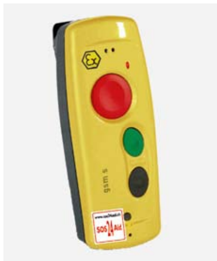
Notrufgeräte gibt es heute für wenig Geld.

Kein verfügbarer Personenschutz für Alleinarbeitende oder untaugliche Nothilfeprozesse sind die grössten Verursacher von Folgeschäden. Es gilt, sich folgende Frage zu stellen: Verfügen die Personen über die erforderlichen Hilfsmittel, Rettungskompetenz und kann die Reaktionszeit der einzelnen Rettungsschritte jederzeit garantiert werden? Die erforderlichen minimalen Erreichbarkeiten und Reakti-