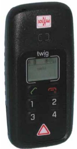
So könnte Ihr persönlicher Nothelfer aussehen

am folgenden Tag fertigzustellen. Fahrzeiten und Energie können eingespart werden. Es bedarf auch nicht immer des gesamten Teams. Wo konsequent moderne Maschinen und Hilfsmittel eingesetzt werden, wird vermehrt alleine gearbeitet, insbesondere in Randzeiten. Kleine Baustellen, Pflege und Reinigungsarbeiten wie