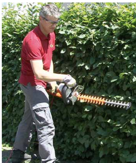
Heckenschnitt ist meist Alleinarbeit gemäss VUV/SUVA

Eine grössere Flexibilität bei der Arbeitszeit ist heute erwünscht. Ihre Mitarbeiter sind meist bereit, sich den aktuellen Gegebenheiten oder Kundenwünschen flexibel anzupassen. Einzige Voraussetzung ist, dass die Mitarbeitenden selber von Fall zu Fall in eigener Verantwortung entscheiden dürfen, ob und wann sie den Sondereinsatz leisten. Als Entgegenkommen muss eine flexible und unbürokratische Kompensation möglich sein. Im Werkhof und auch im Strassenunterhalt ist Einsatzbereitschaft viel wichtiger als die geplante Präsenzzeit. Arbeiten sind dann zu erledigen, wenn diese anfallen. Ob Schnee oder Reste der Sommerparty aufgeräumt werden müssen, der Zeitpunkt ist entscheidend. Häufig ist es effizienter, eine Arbeit noch am selben Tag zu verrichten, als diese erst