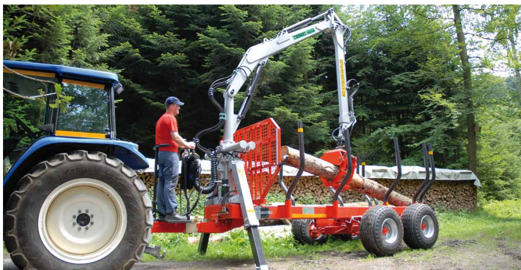
Beim Aufladen des Schnittguts ist man effizienter alleine ... aber wo wäre ein Nothelfer?